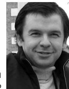
Nuno Graça Moura Arquitecto

Este folheto é meramente informativo. As informações nele contidas não constituem valor contratual.