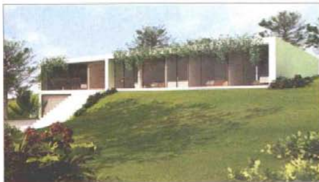
SOUTO MOURA – Vista para a Natureza. Uma vez mais parece ser a terra a moldar o casario