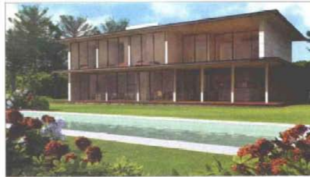
RUI PASSOS – Concepção de traça tradicional com o terraço térreo e o sol a invadir as janelas