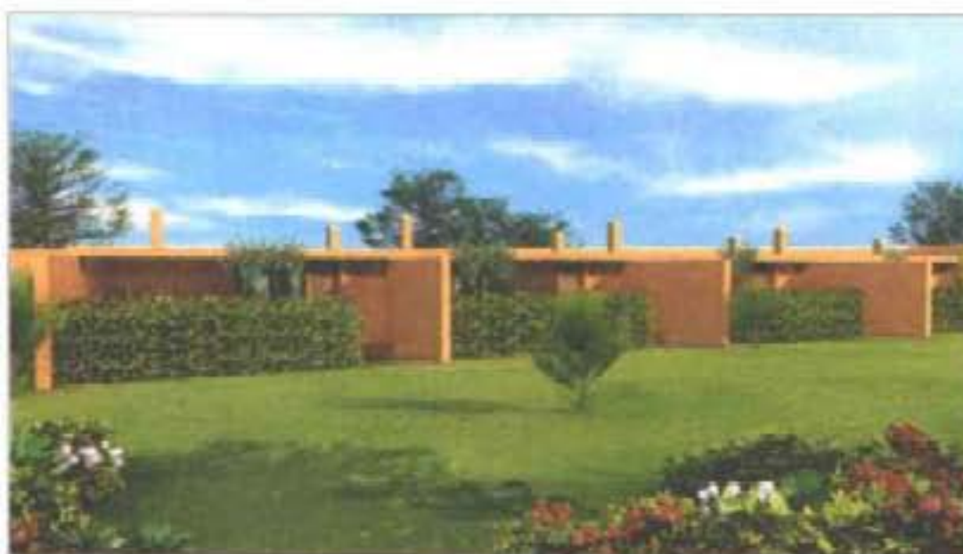
LUÍS MOREIRA – O arquitecto casa o verde da paisagem com o ocre do cimento em casas baixas