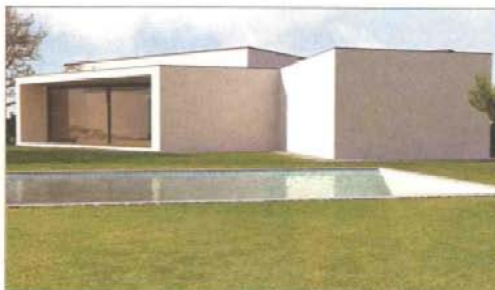
ÁLVARO SIZA – O branco e as linhas rectas e ângulos desconcertantes marcam a sua casa