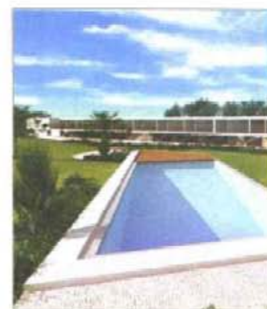
INÊS LOBO – O desenho nesta concepção de luz