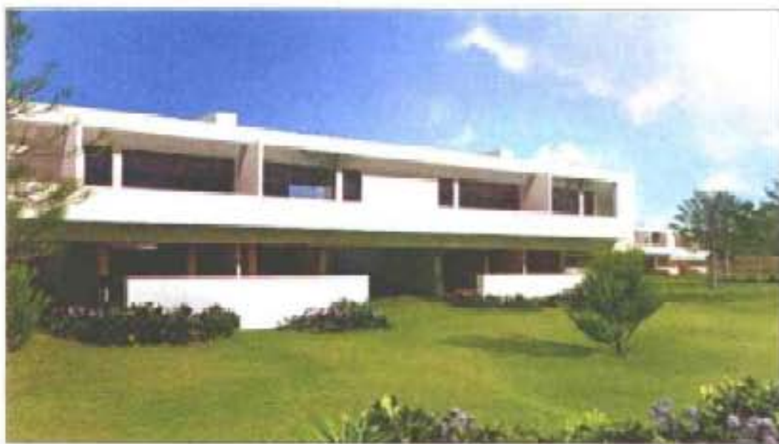
MADALENA MENEZES – Uma casa virada ao sol, com janelas rasgadas e varandim de passeio