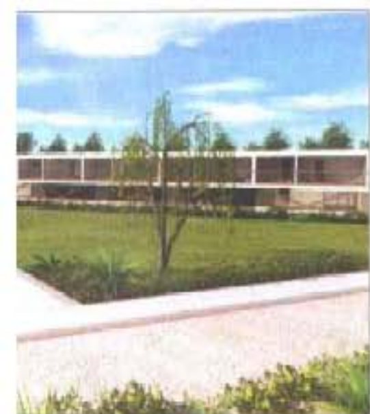
da água rasga o jardim, e alegria fresca