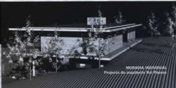
MORADIA INDIVIDUAL Projecto do arquitecto Rui Passos