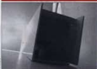
LOCAL – Maquete de Gonçalo Byrne e local onde vai surgir esta aldeia ideal