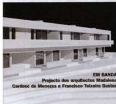
EM BANDA Projecto dos arquitectos Madalena Cardoso de Menezes e Francisco Teixeira Bastos