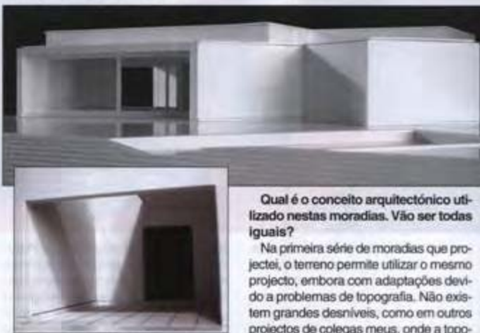
Maquete de uma moradia desenhada por Siza Vieira

Eu vou fazer o clube de golfe, 14 moradias, que é o que está mais adiantado, e ainda a portaria/recepção e a zona comercial.