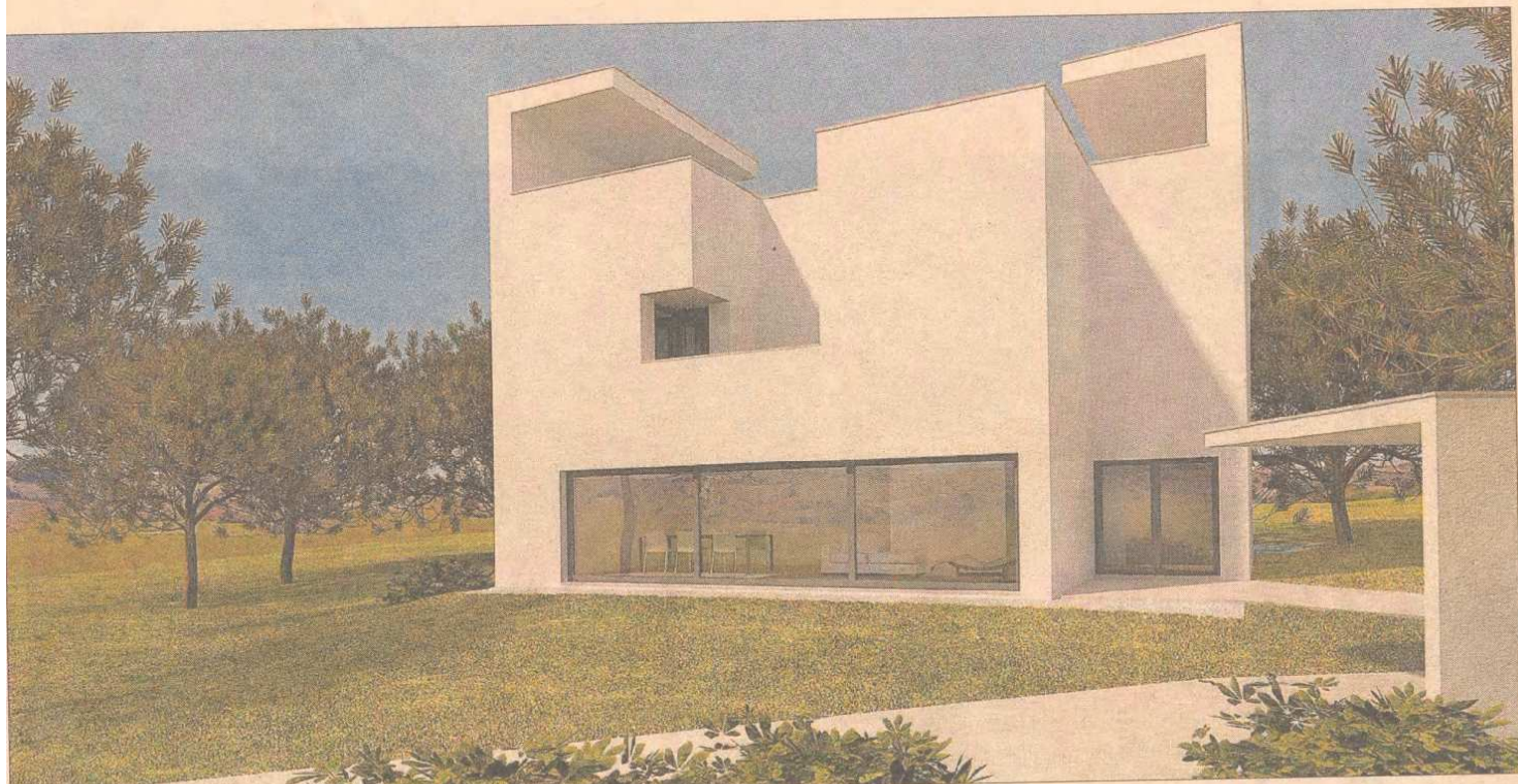
Vivienda diseñada por el arquitecto Álvaro Siza.