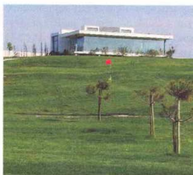
Donald Steel ha sido el arquitecto encargado de diseñar el campo de golf del resort de Bom Sucesso

Este recorrido ha sido concebido por Donald Steel, uno de los más prestigiosos arquitectos de golf del mundo, famoso por su experiencia en el diseño de otros campos con similares características. En esta nueva creación ha conseguido satisfacer a todo tipo de jugadores, tanto a aquellos que buscan grandes desafíos como a quienes disfrutan con hándicaps mayores. Es un reto para los profesionales y los aficionados, ya que la variedad de tees de salida hace que las grandes distan-