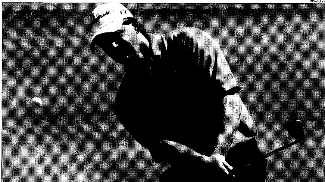
Golf do Oeste atrai cda vez mais praticantes

Os campos de golfe do resort Bom Sucesso e o Royal Óbidos, do grupo Oceânico, aderiram este ano à parceria Golfoeste, sendo membros de pleno direito o que, "desde logo, atesta o interesse que estas empresas