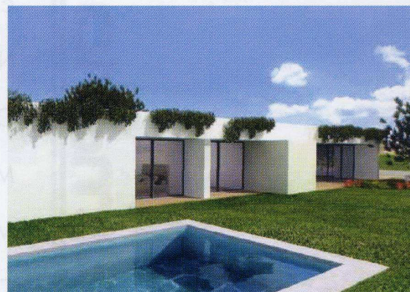
Aldeamento "Bom Sucesso"

O "Bom Sucesso" fazendo jus ao seu nome, das 600 unidades residenciais, 510 já foram comercializadas, com destaque para os investidores ingleses, que se espera virem a tornar-se proprietários de 40% do «Resort».