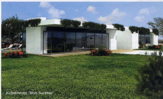
Aldeamento "Bom Sucesso"

O número de construções será de 601 fogos (340 lotes de moradias individuais e 261 moradias em banda) no entanto estão previstas mais 500 unidades residenciais. A construção de um Hotel de cinco estrelas, campo de golfe de 18 buracos, SPA, piscina,