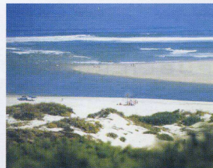
Lagoa de Óbidos

doso Meneses? Em comum apenas um dos maiores projectos imobiliários do país. Está a nascer em Óbidos e intitula-se "Bom Sucesso", Design Resort, Leisure, Golf & SPA.